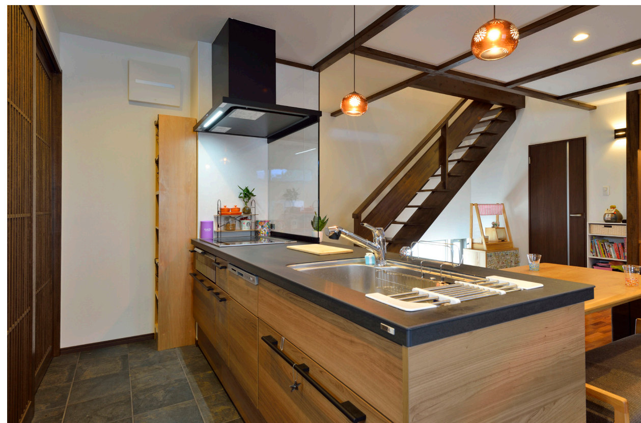
ダイニングキッチンは掃除のしやすいタイル床。階段は蹴込み板のない木製のスケルトン構造。開放的な空間づくりに一役買っている