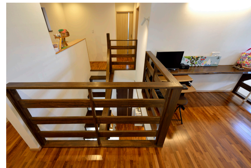
2階のファミリースペースにはカウンターデスクを造り付けた。吹き抜けに面しているので、階下とコミュニケーションが取りやすい