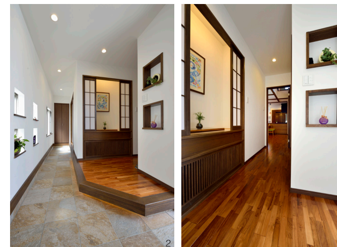
1.通り土間から直接入れる和室。床の間の壁を煉瓦色にして空間のアクセントにし、どんなインテリアにも馴染みやすい琉球畳を取り入れた 2.玄関扉を開けると、町家の通り土間を思わせる細長い土間が奥へ続いているのが見え、来客は土間の奥に配された和室へと導かれる 3.玄関ホールには障子付きのニッチをしつらえた。季節に合わせた雑貨やお気に入りの絵、植物などを飾って空間に彩りを添えている