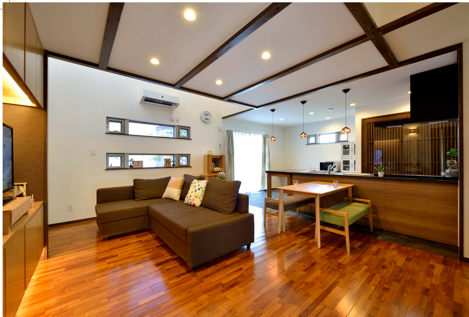
リビングの西側は開口を抑え、通風・採光は上部の吹き抜けで対応。キッチン背面には縦格子の引き戸が付いた大容量の収納庫が設けられている