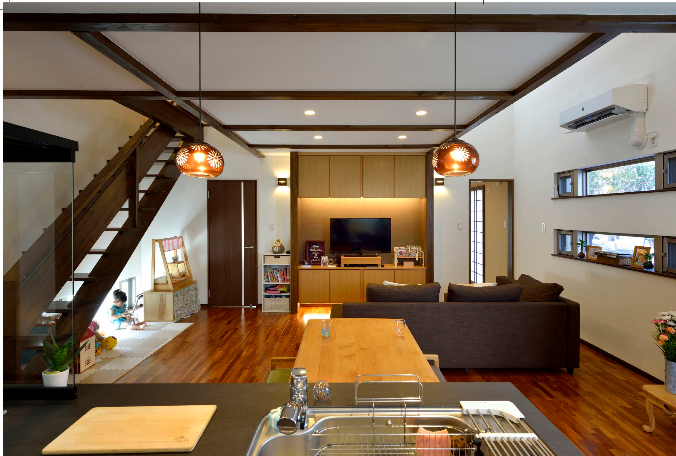
キッチンからリビング全体を見る。天井の梁や階段などの木部をダークブラウンで統一して落ち着いた和モダンテイストの空間を演出

木の質感や落ち着いた色合いにこだわって仕上げた和モダンな家。洗練されているながらも、どこか懐かしさが感じられます。吹き抜けを介して上下階が緩やかに繋がっているためコミュニケーションがとりやすく、程よい光が降り注ぐ中で家族の会話も弾みます。