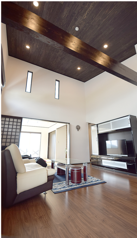
リビングは片流れ屋根を生かした高さ5mの吹き抜けで開放的。天井や梁(はり)のダークブラウンと壁の白のコントラストがモダンな雰囲気を演出