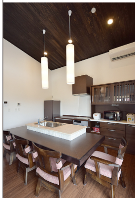
細長い照明が似合う対面シンク。家具や照明などのインテリアにこだわりたくなる空間を実現